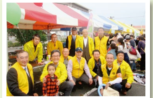
10月27日 ふれあい健康まつり