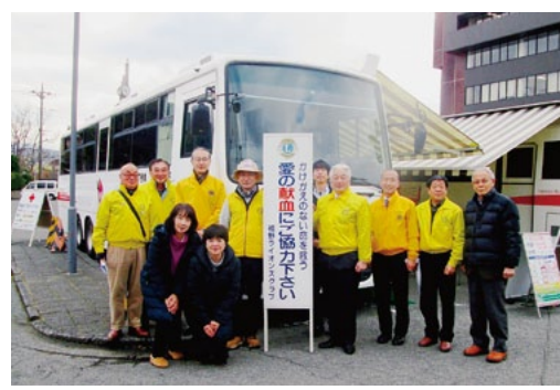
2月5日 献血運動実施