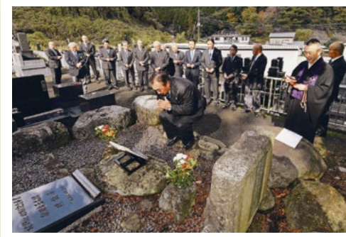
12月3日 献眼供養例会 (静岡新聞 2019年12月6日掲載)