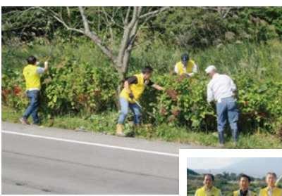
10月2日 クリーン作戦