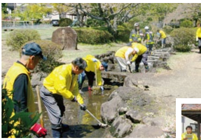
4月16日 せせらぎ児童公園