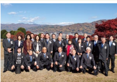
11月16日 諏訪湖訪問例会