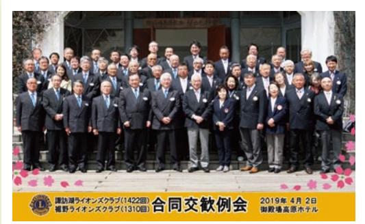
4月2日 諏訪湖L.C.との交歓例会