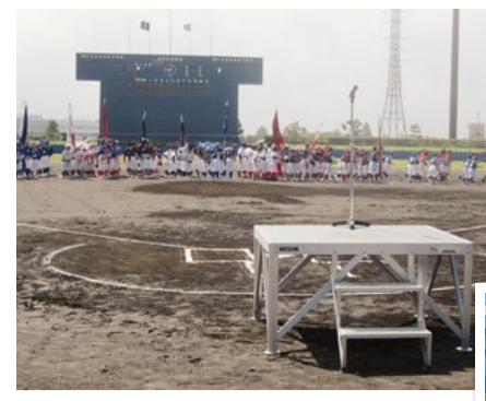
6月8日 裾野L.C.富士山カップ 学童野球協賛