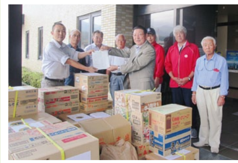
10月6日 フードバンク協力