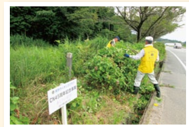
創立45周年で植樹の紫陽花も 継続して整備。つながらり。