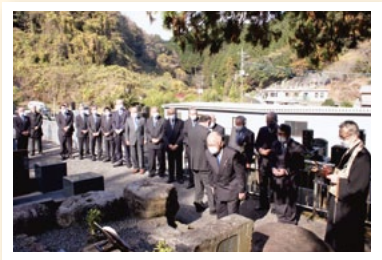
12月1日 献眼供養 於：桃園霊園 献眼の碑