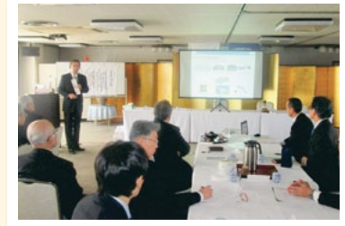
1月21日 会員企業の事例紹介 健康例会