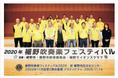
11月14日 裾野吹奏楽フェスティバル