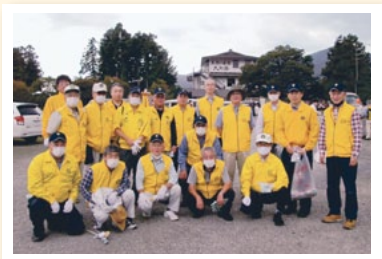
10月6日 クリーン作戦