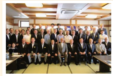
9月15日 みんな元気！ 100%出席例会