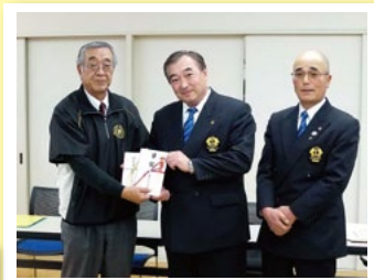
裾野ライオンズクラブ富士山カップ 選抜学童野球裾野大会に協賛加えて 投球数カウンター等も寄贈