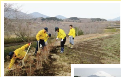
芝生のひろばに ドウダンツツジ植樹