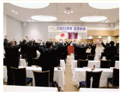
継続祈念のライオンズ・ローア